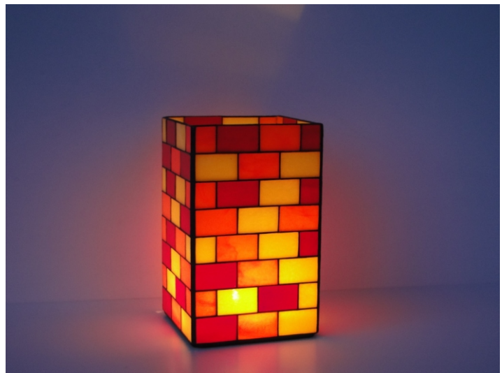
Die Vase ist auch als Kerzenleuchter geeignet