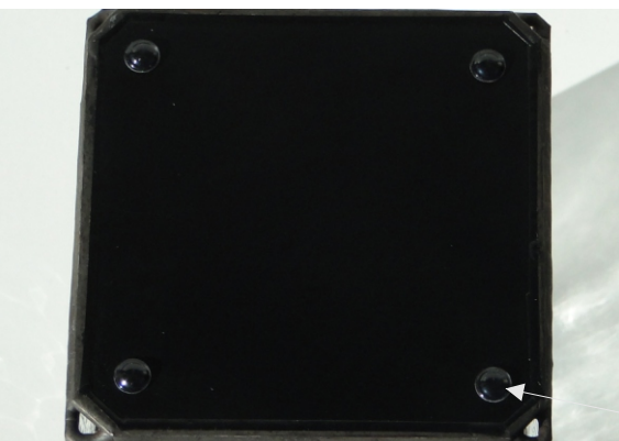
Beispiel Boden mit Luftlöchern

Nach der Endreinigung der Vase empfehle ich den Boden zu lackieren - dies sieht hochwertiger aus, als die gewöhnliche Spiegelbeschichtung.