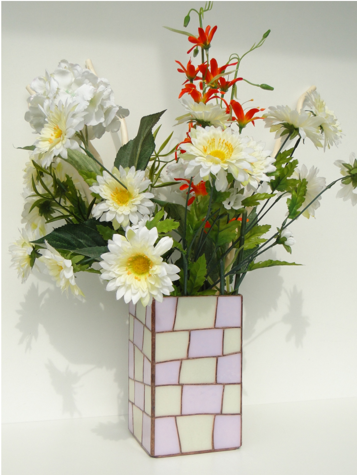
Blumenvase " Natural "