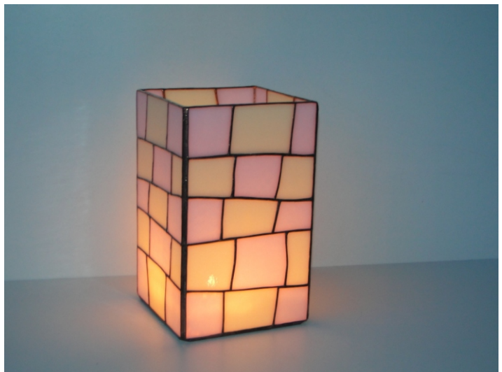
Die Vase ist auch als Kerzenleuchter geeignet

Für den Boden nehmen Sie Spiegel, so können Sie diese Vase wahlweise auch als Kerzenleuchter nutzen. Ich empfehle die Schnittkante vor dem Folieren mit Spiegelschutzlack einzustreichen. Auch ist es sinnvoll, die Kupferfolie an der beschichteten Seite etwas weiter überlappen zu lassen.