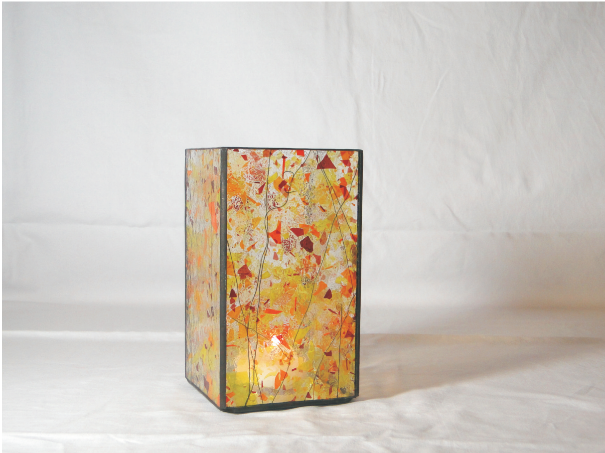
Kerzenleuchter "glass art" Maße ca. 10 x 10 x 18 cm