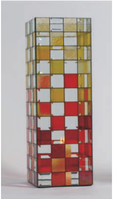
“ Feuer und Flamme “

96 Facetten/Bevels 51 x 51 mm ( 2" x 2" ) Artikelnummer 85 130 02