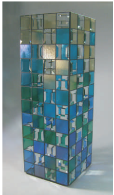
“ Caribbean Flair “

96 Facetten/Bevels 51 x 51 mm ( 2" x 2" ) Artikelnummer 85 130 02