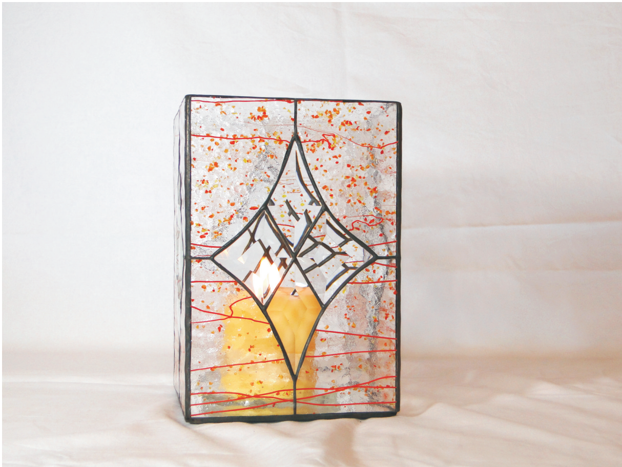
Kerzenleuchter "ornament" ca. 15 x 23 cm