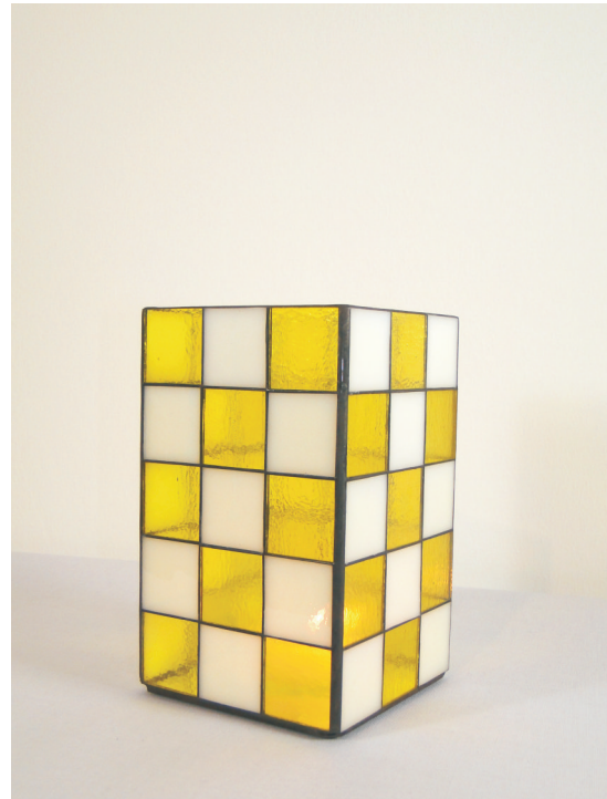
30 Teile 38x38mm citro-gelb Bullseye 1020-31Firi 30 Teile 38x38mm transparent weiß, Bullseye 0243-30F ( vorgeschmolzen )