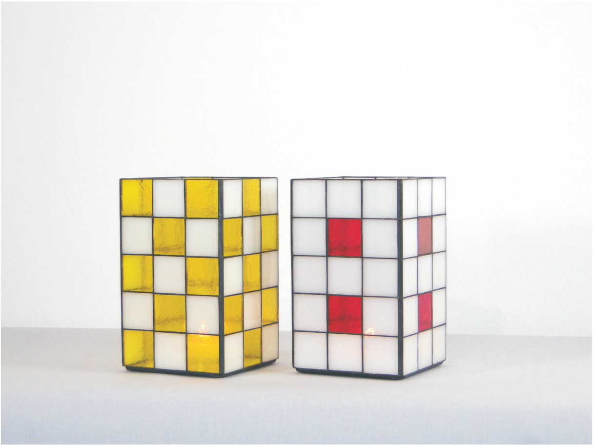
Kerzenleuchter "quadro" Maße ca. 12 x 12 x 20 cm