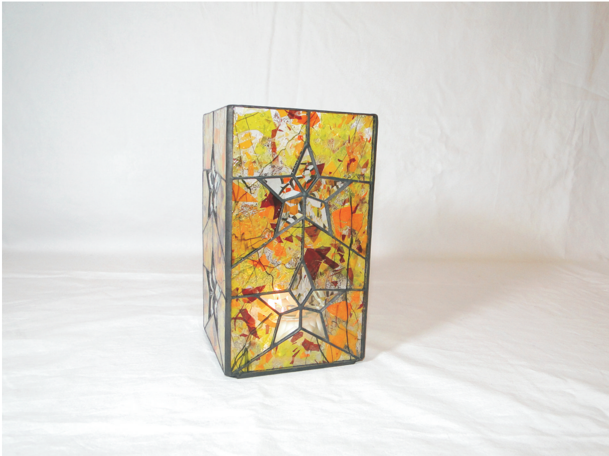
Kerzenleuchter "star light" Maße ca. 10 x 10 x 20 cm