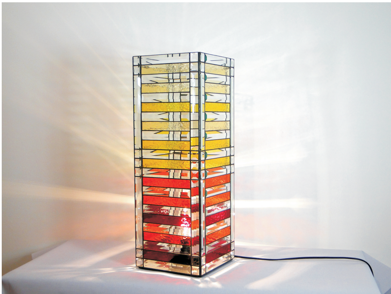
Kerzenleuchter "tower 1"