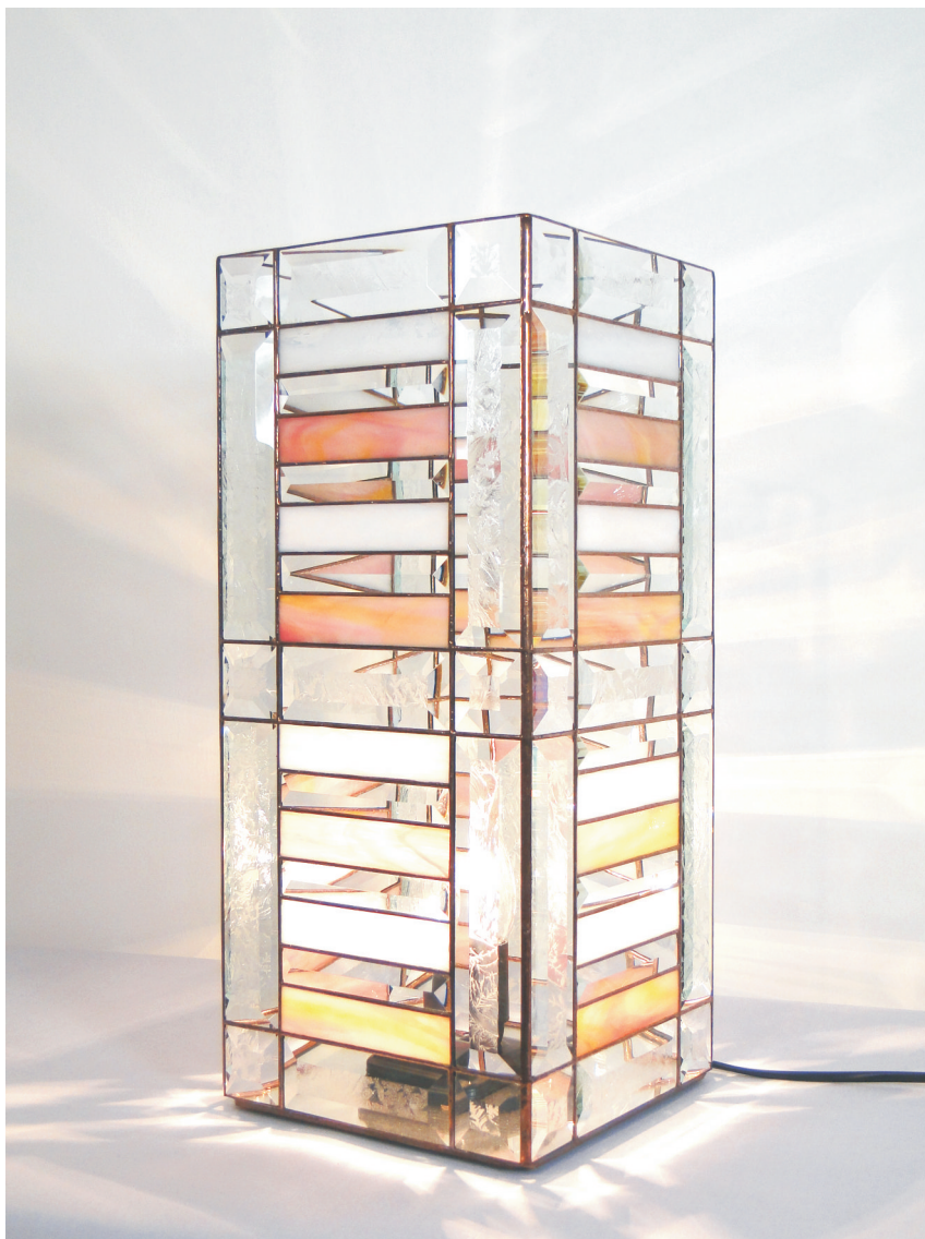
Kerzenleuchter "tower frame" Maße ca. 18 x 18 x 42 cm