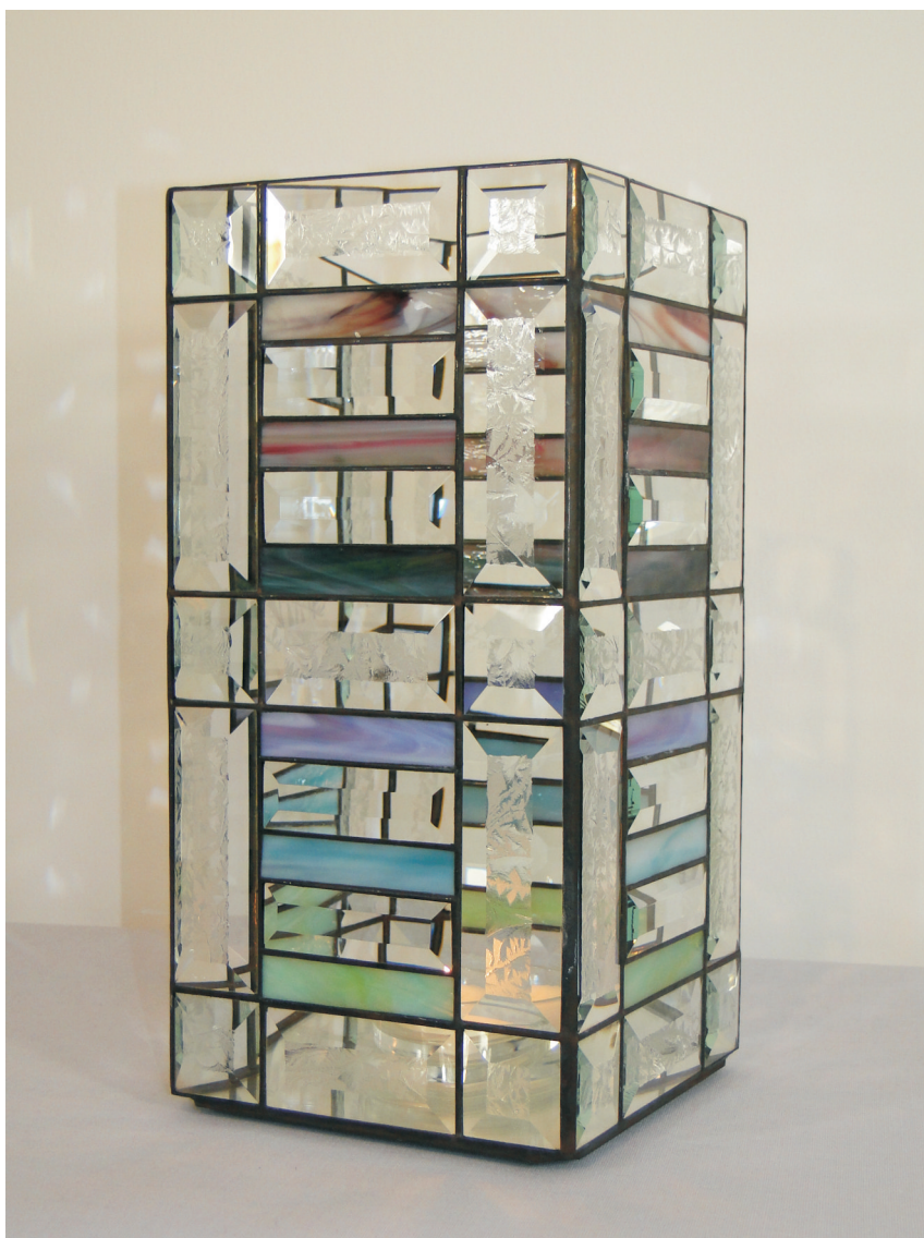
Kerzenleuchter "tower frame" Maße ca. 15 x 15 x 32 cm