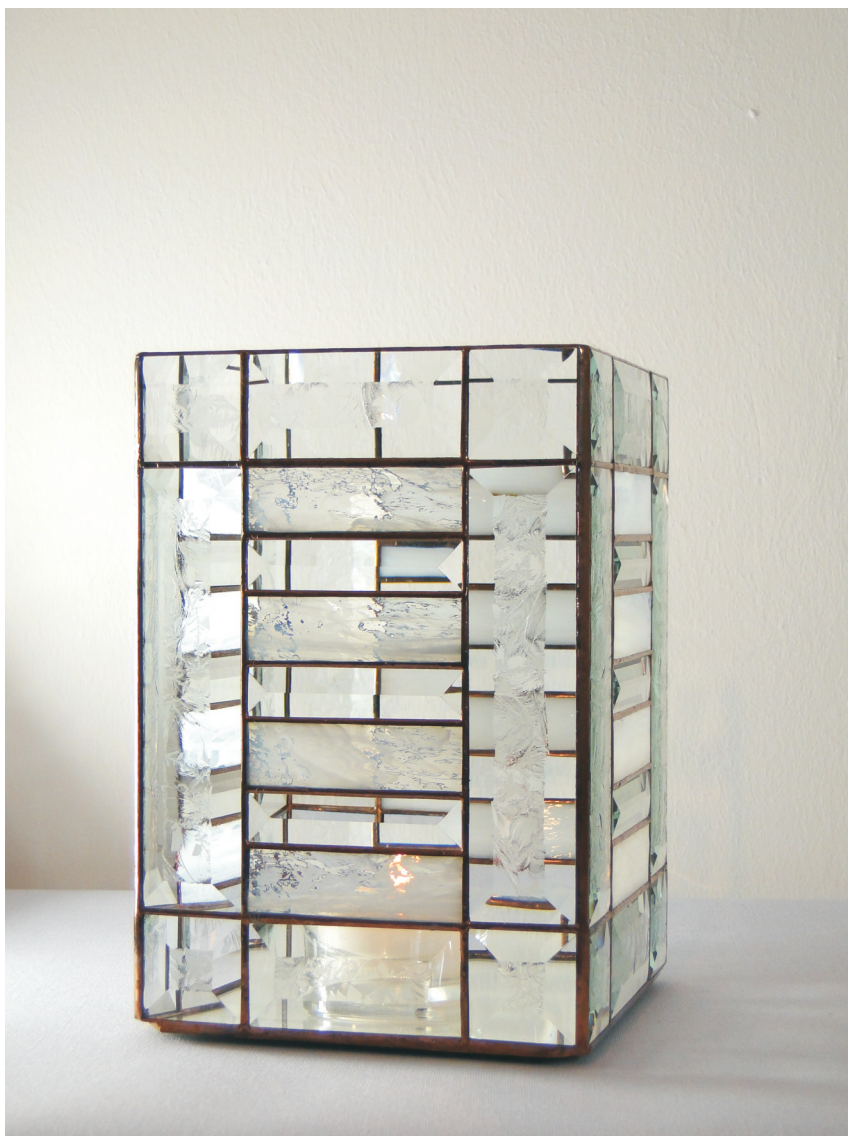
Kerzenleuchter "tower frame" Maße ca. 15 x 15 x 23 cm