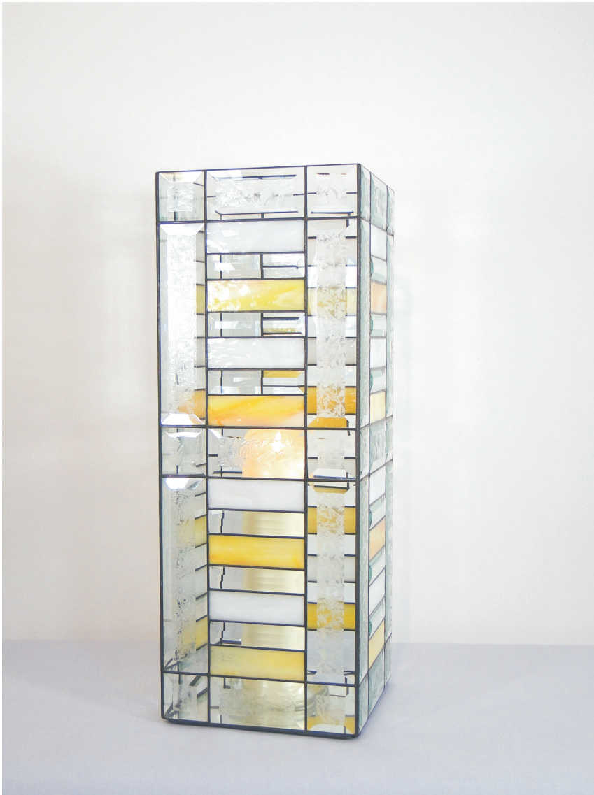
Kerzenleuchter "tower frame" Maße ca. 21 x 21 x 52 cm