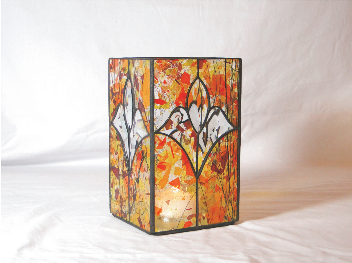
Kerzenleuchter "tulip" ca. 12 x 21 cm