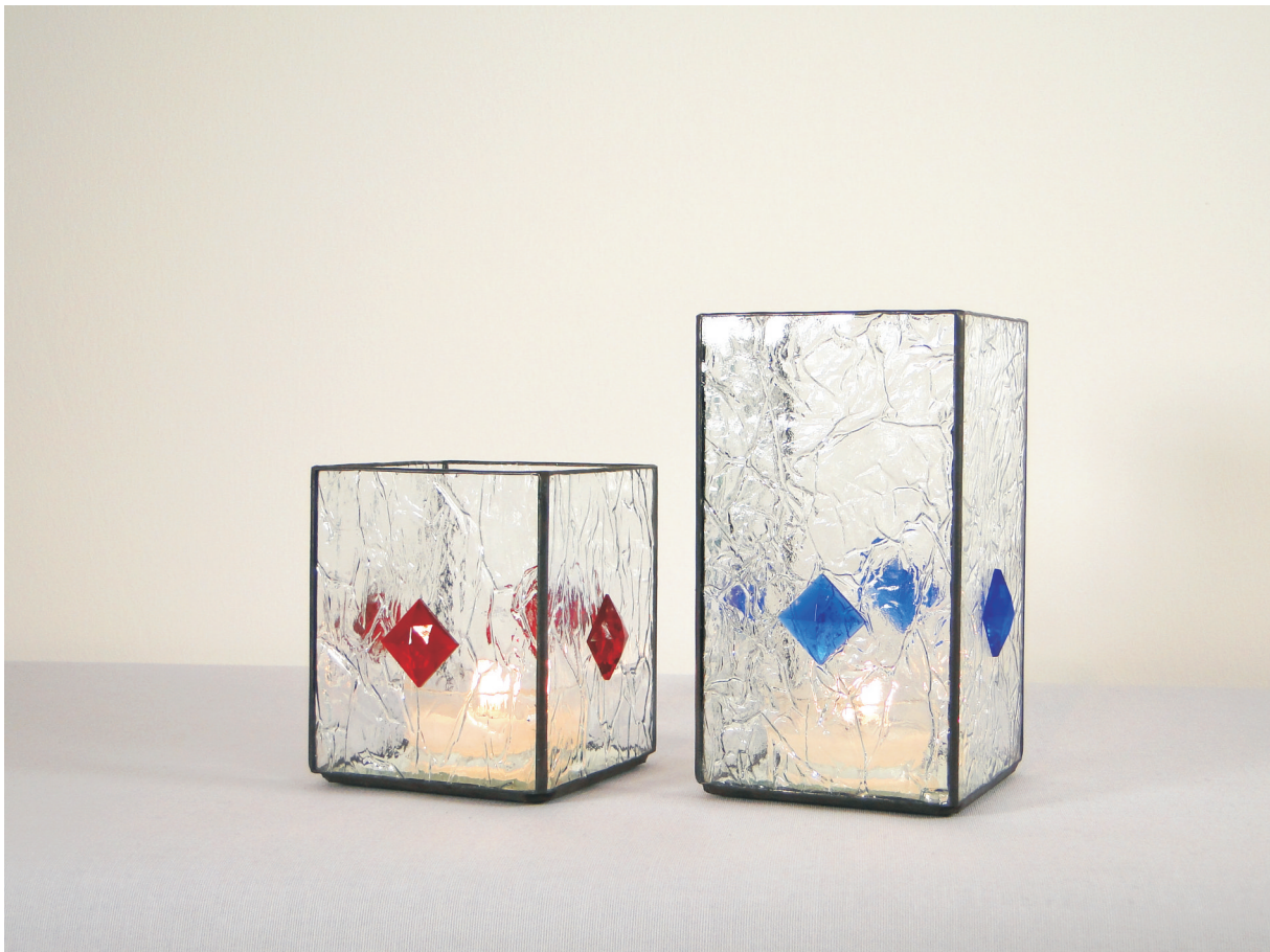
Teelicht "glass jewels" ca. 10 x 12 cm, 10 x 18 cm