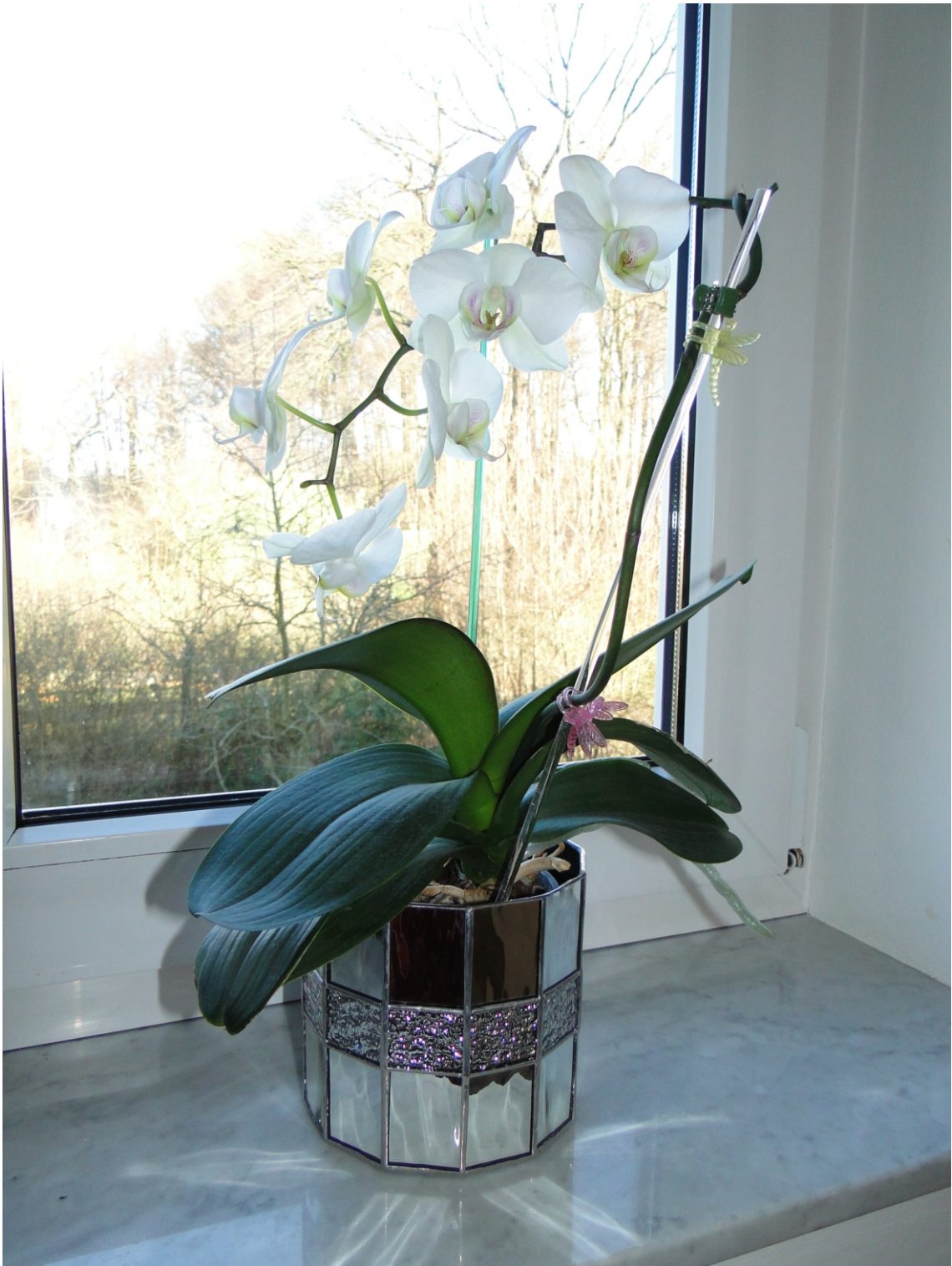
Übertopf " Silber "