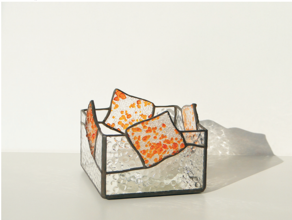
Teelicht „Feld“ ca. 10 x 10 cm