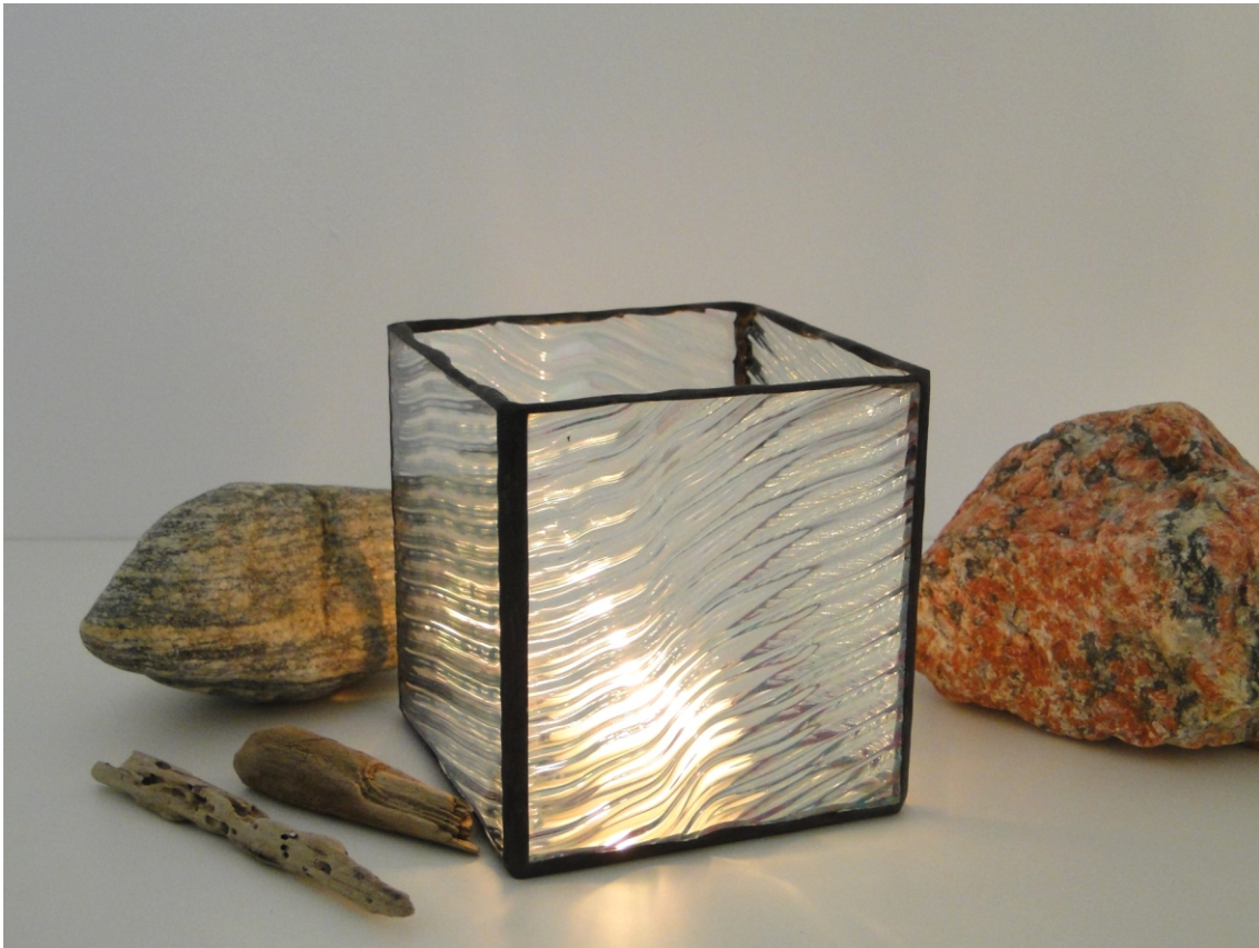
Teelicht " GoodGlass " ca. 12 x 12 x 13 cm