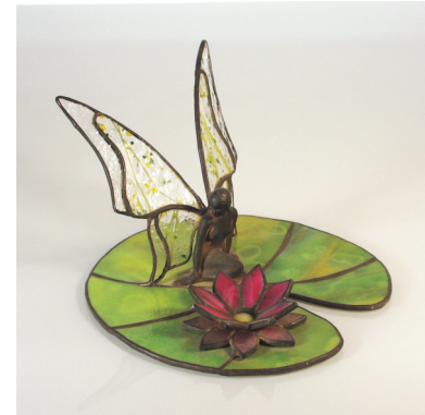
27 904 00 Zinnkörper sitzende Lady