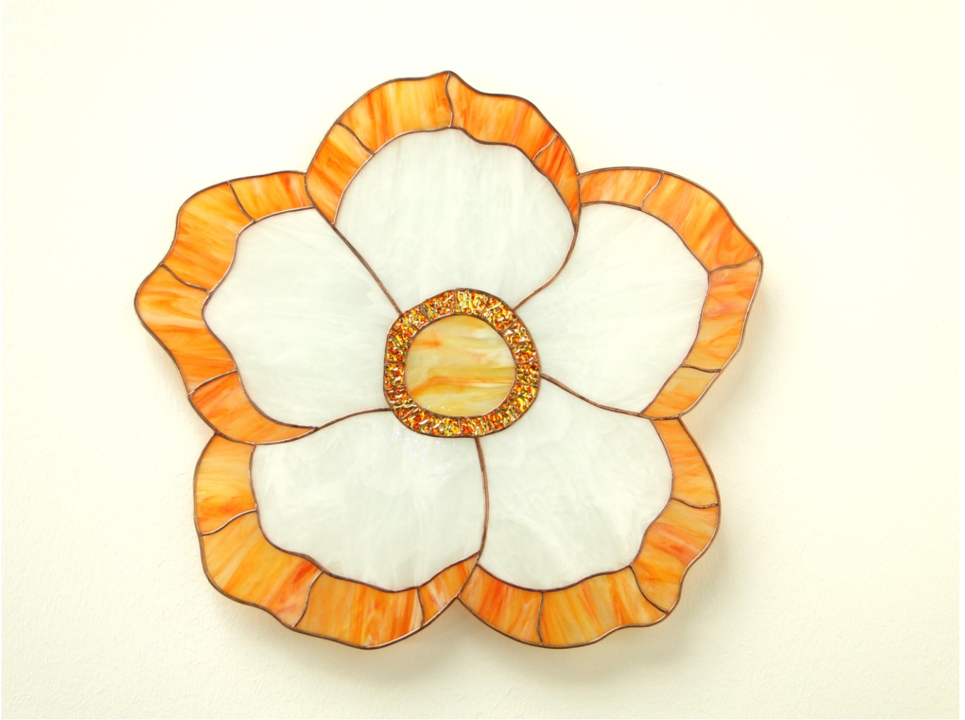
Raumgestaltung "Flora" im Original ca. 65 x 60 cm