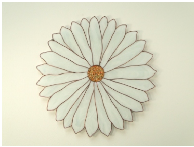
Raumgestaltung " Große Margerite - large daisy "