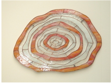
Raumgestaltung " Growth Rings - Jahresringe "