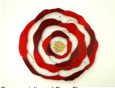
Raumgestaltung " Rose Flower - Rosenblüte "