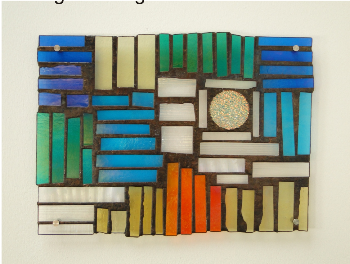
Raumgestaltung " SUNSET "