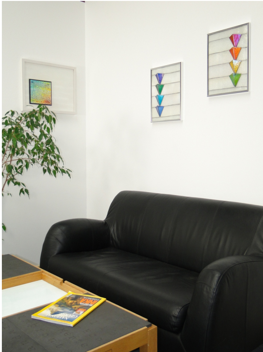
“ Drachen “