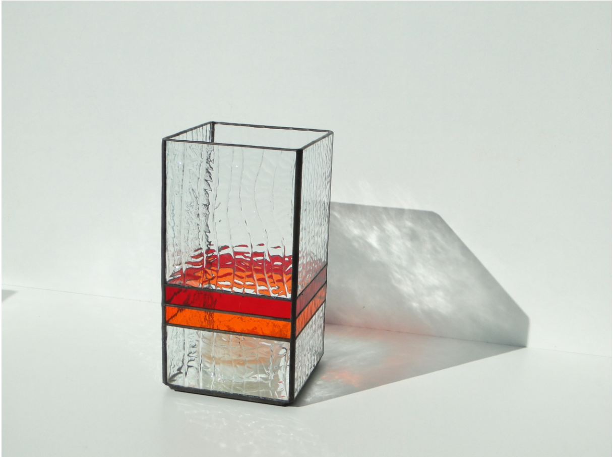
CandleLite "Flair" ca. 10 x 10 x 19 cm