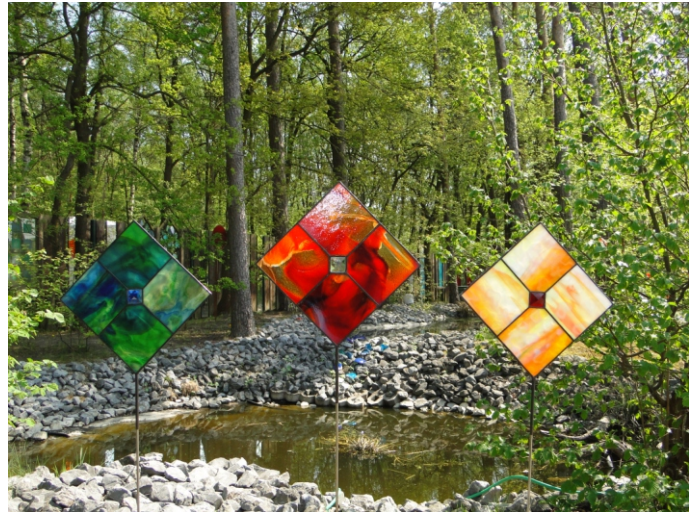
Garden Sticker "diamond"