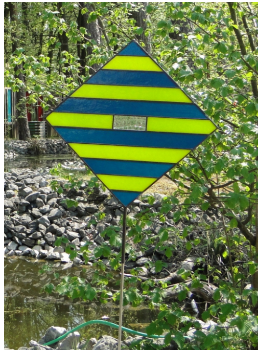
Edel gestaltetes Glas im Garten