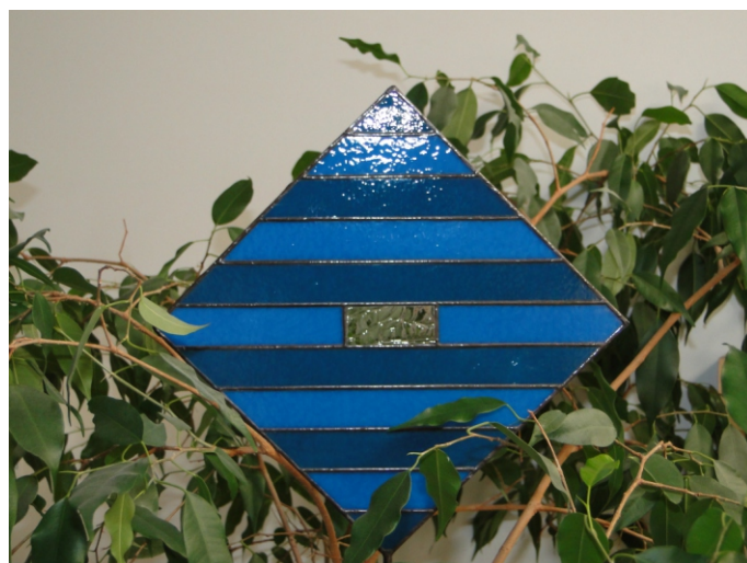
....Design auf kleiner Fläche...