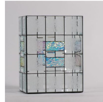
Kerzenleucher " cuboid "