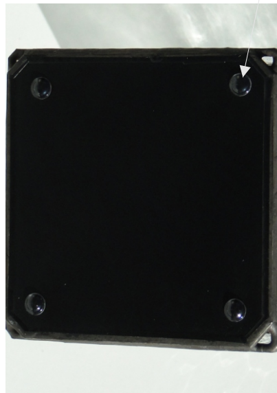
Beispiel Boden mit Lüftlöchern

Glas A : Wissmach Mystic 0001 Glas B : Wissmach Mystic 47