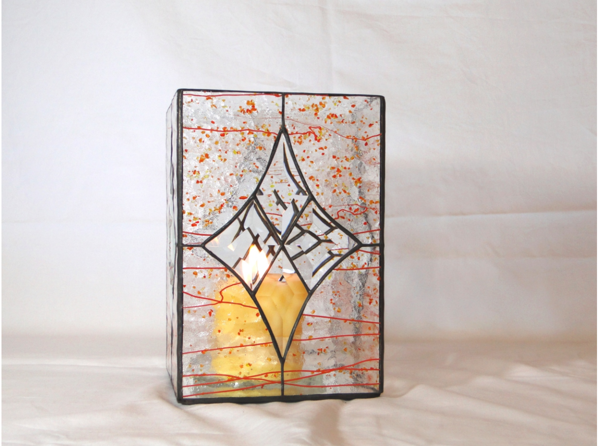
Kerzenleuchter "ornament" ca. 15 x 23 cm