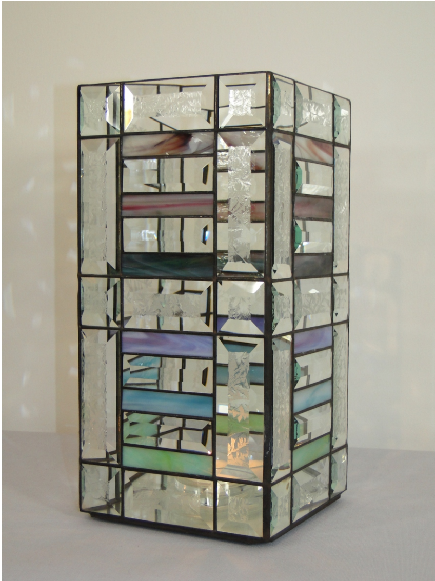
Kerzenleuchter " tower frame " Maße ca. 15 x 15 x 32 cm