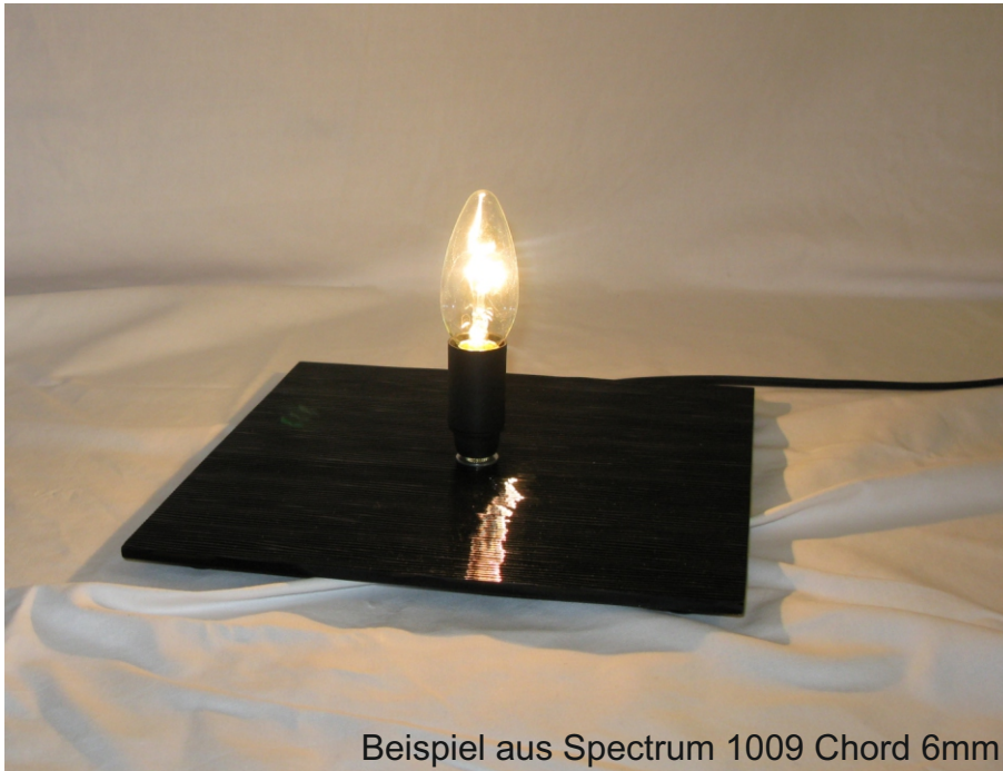
Beispiel aus Spectrum 1009 Chord 6mm