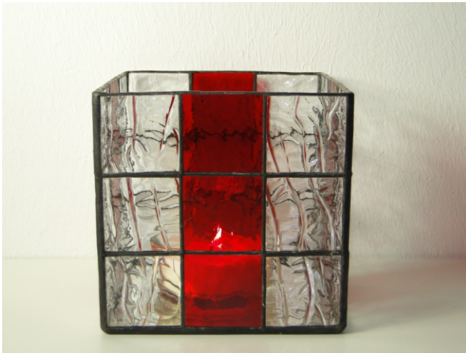
Spectrum 100 CZ, klar Spectrum 151 RR, rot