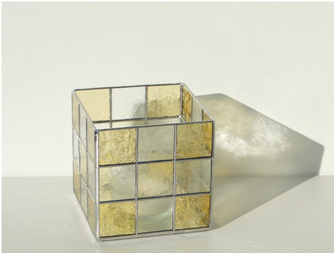
Eisblumenglas, klar Wissmach 0001 Mystic, blass amber Wissmach 0002 Florentine, hell amber