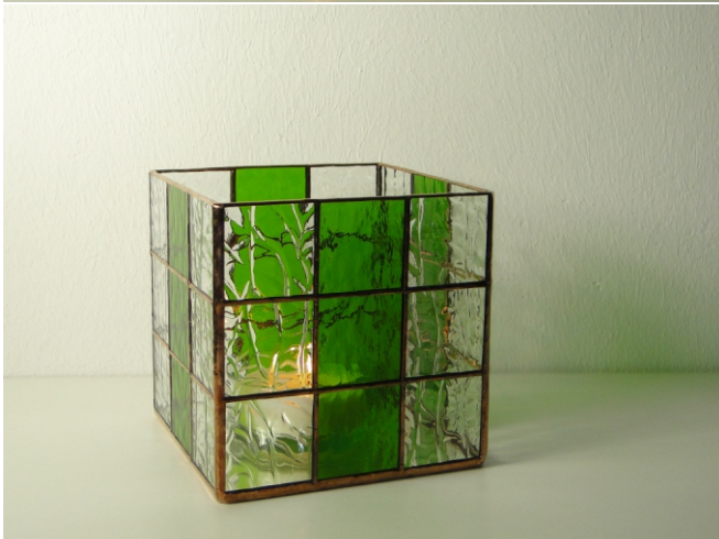
Spectrum 100 CZ, klar Spectrum 526-2 RR, grün