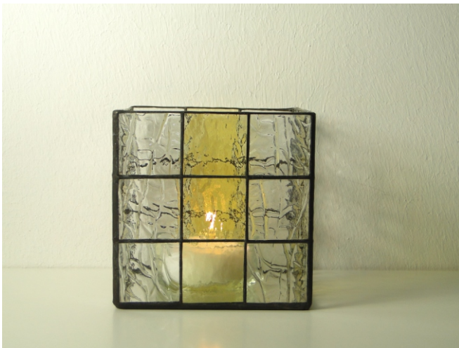
Spectrum 100 CZ, klar Spectrum 110-1 RR, hell amber