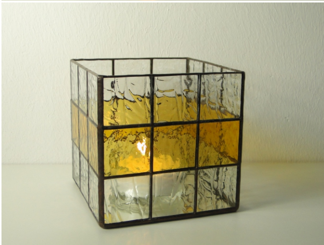
Spectrum 100 CZ, klar Spectrum 110-2 RR, amber