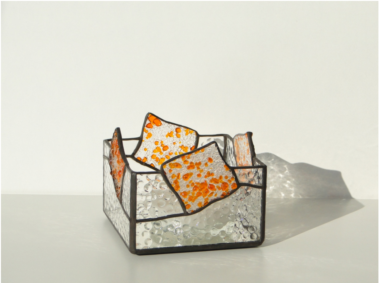
Teelicht „Feld“ ca. 10 x 10 cm