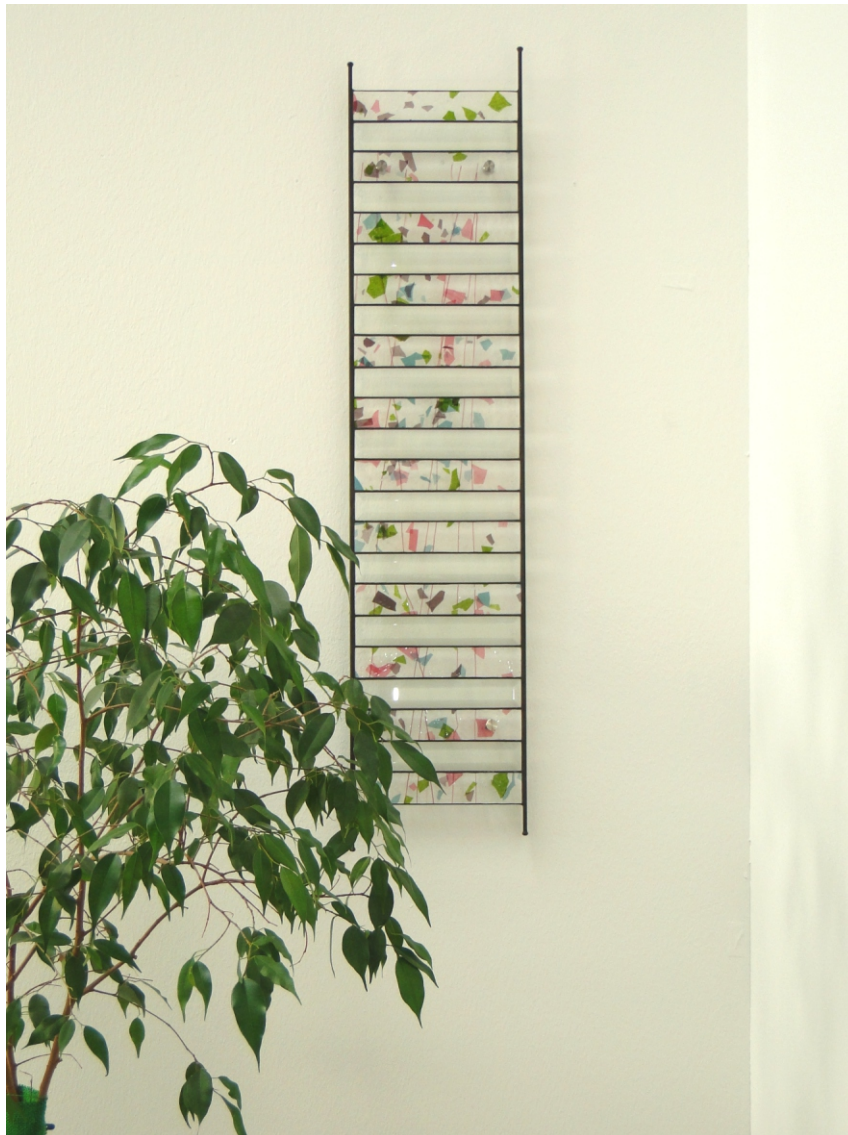
“ Bevel Lines “